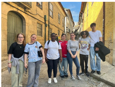
Rua Santa Maria