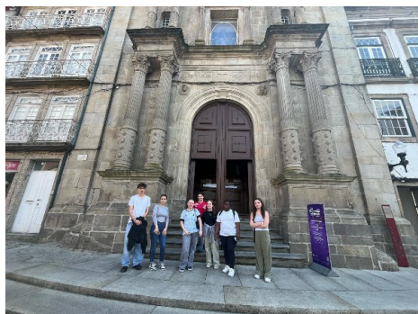
Iglesias De Oliveira

Ensuite, nous avons exploré le centre historique de Guimarães, classé au patrimoine mondial de l'UNESCO. Nous devions faire un jeu de piste et prendre une photo devant plusieurs monuments historique et lieu pour prouver que nous avons réussi. Cela nous a permis de découvrir et d'apprécier la richesse du patrimoine édifié de cette ville tout en s'amusant.