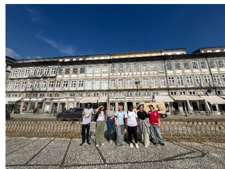
Largo Do Toural